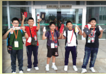
到農夫山泉參觀，了解到飲料的生 產過程，還有禮物呢！