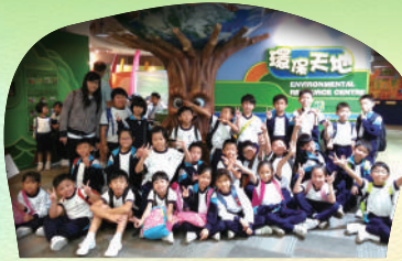
二年級 - 粉嶺環境資源中心