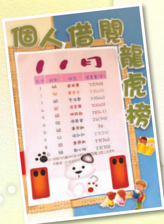
每個月公佈全校 Top 10，競爭十分激烈，愛閱讀的同學越來越多了！

閱讀能豐富孩子的生活，充實孩子的學習，觸動孩子的心靈。為了讓同學們享受閱讀，快樂地盪漾於書海中，圖書館舉行了一系列的活動。