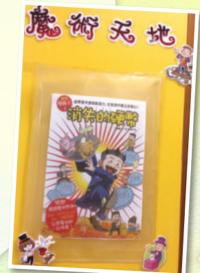
為了迎合同學對魔術書的熱愛，圖書館設有魔術天地供同學閱讀！