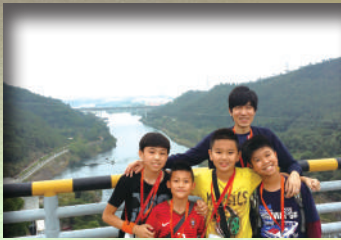
參觀新豐江水電站，我們才了解到 河源的水利建設非常完備！