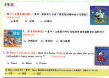
每兩個星期為同學選出3本有趣的中文圖書，凡完成問題，答對而又被抽中的同學有機會得到特權卡。