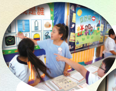
大使們認真地和同學玩普通話遊戲。

我們還出動一班「黃陳小精英」擔任普通話大使，為大家主持早會、攤位遊戲及與同學以普通話交談。看他們多認真！多投入啊！小息時，同學們很熱烈地在說普通話、玩遊戲，氣氛很熱烈啊！