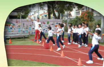
三年級 - 田徑示範及活動