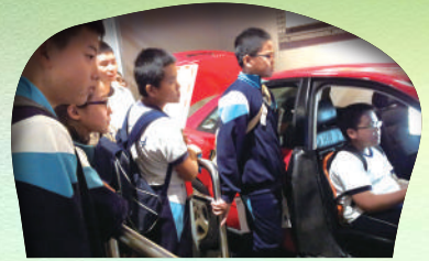
六年級 - 香港科學館