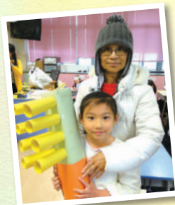
婆婆幫我做的道具