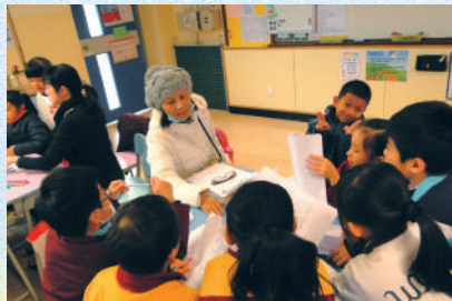
他們在討論角色分配