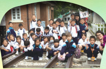
一年級 - 香港鐵路博物館

本校於十一月六日安排各級學生參觀不同地點作全方位學習，著學生多觀察，多思考，利用所搜集的資料進行探究，提高學生學習興趣。