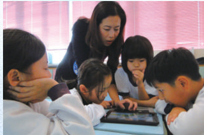
故事媽媽和同學們在用 Ipad 分享故事

為培養學生的閱讀能力及興趣，一班熱心的義工家長成為了學校的良好夥伴——「故事爸媽」。他們不僅在逢星期四第三個小息到圖書館為低年級同學講故事，還抽了不少時間去協助三年級同學創作故事。讓同學享受到閱讀的樂趣及喜悅，更感受到「故事爸媽」對他們的愛護，留下了美好的記憶。