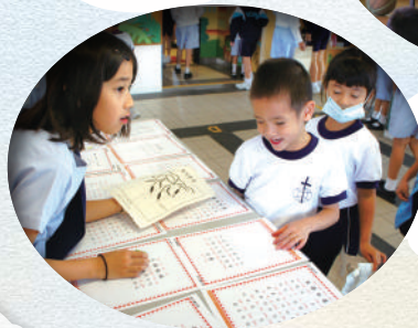
大使們耐心地聆聽低年級同學說普通話。