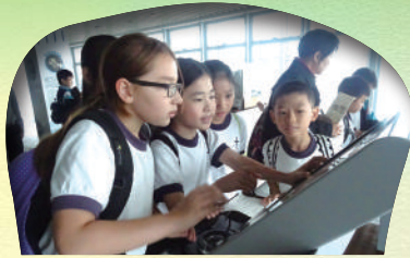
五年級 - 機電工程署 能源效益事務處教育徑