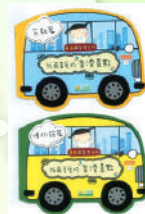
每個學期圖書館都有新書推介，同學都十分期待！