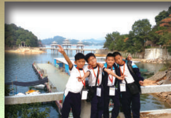
萬綠湖和鏡花緣風景區讓我們體驗到大自然的美好！