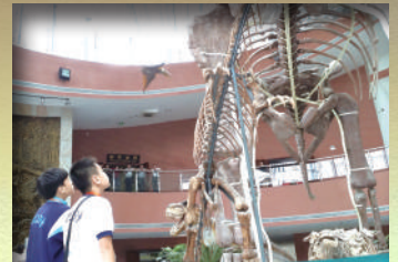
恐龍博物館內的展品真壯觀啊！