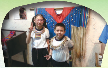
四年級 - 嘉里白鷺湖互動中心 (人類民俗文化館)