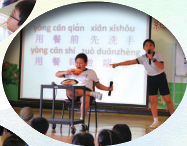
普通話大使們透過風趣幽默的表演，教大家講日常用語。