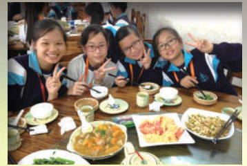
美味的午餐，好期待喔！