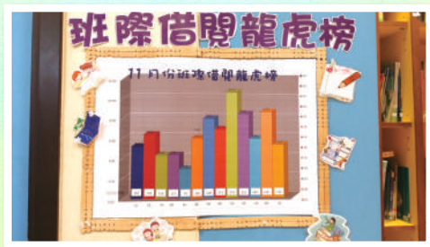
每月公佈比賽結果，同學對自己班的排名十分在意，紛紛努力借書看。