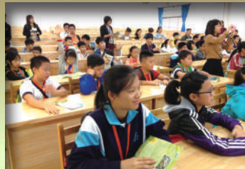
元西小學的數學課令同學獲益良多！

為擴闊學生視野，豐富生活體驗及加深對祖國的認識，本校參與教育局資助之「同根同心 - 香港小學生內地交流計劃 (2014)」，於本年度 11 月 5 至 7 日帶領學生前往廣東河源進行三天之境外學習活動。