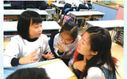
同學和故事媽媽熱烈地討論故事內容