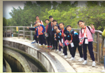
我們在了解污水淨化過程！