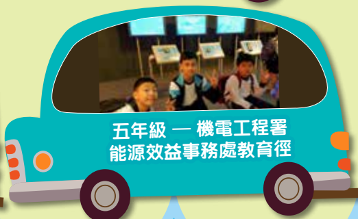
五年級 - 機電工程署 能源效益事務處教育徑