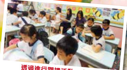
透過進行觀課活動，本校與其他學校作專業交流。