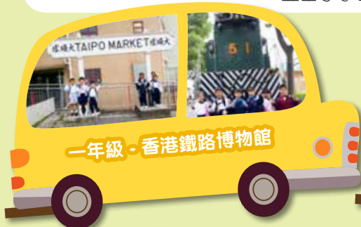
一年級 - 香港鐵路博物館