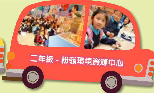
二年級 - 粉嶺環境資源中心