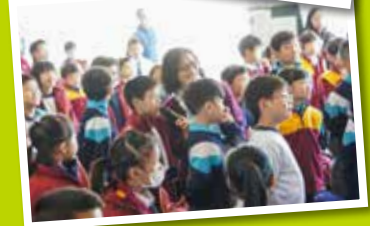
一心哥哥講解生動，又與台下同學互動，向台下的學弟學妹發問，同學們都非常積極參與。