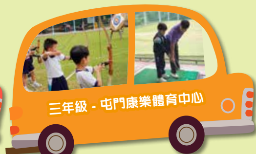
三年級 - 屯門康樂體育中心