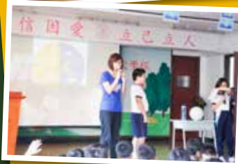
同學在勤學早會 ICAN 劇場用心地演出，又載歌載舞，向同學宣揚勤學上進的信息。