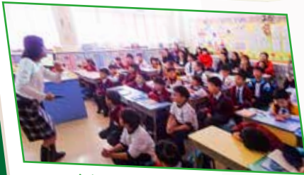
老師用心教學，細心指導。