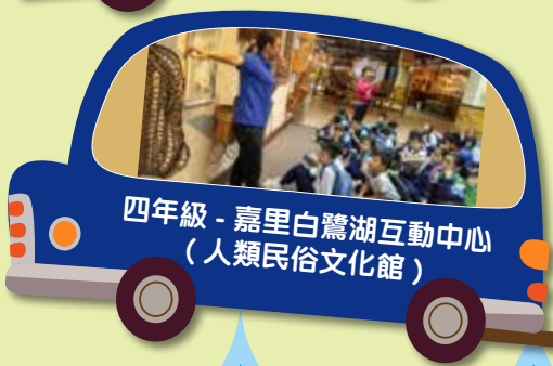
四年級 - 嘉里白鷺湖互動中心 (人類民俗文化館)