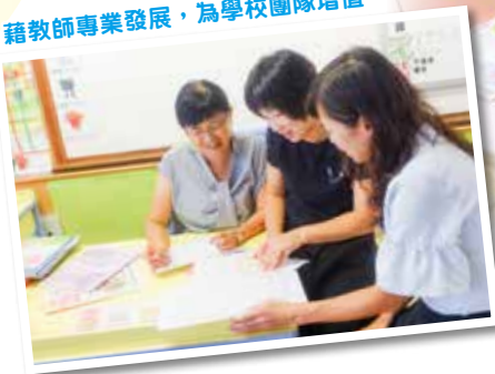
教師進行共同備課，仔細認真地設計課堂教學。