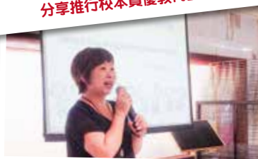
「高參與、高回饋、高展示」課堂教學工作坊