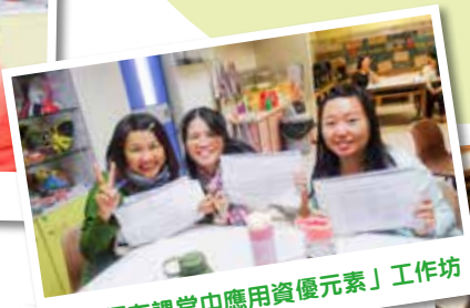
「如何在課堂中應用資優元素」工作坊

為了優化學與教，提升學生的學習效能，本校致力推動教師專業發展，加強教師的專業能力，更推動校內教師的專業交流，以進一步優化教學。為此，學校舉辦了不同的教師專業發展活動，如工作坊、同儕備課及觀課，及與校外專業機構合作進行校本課程等，以提升教學效能，建立學習型團隊。本學年初，學校舉辦了多個教師專業發展活動，主題包括多元化教學策略、電子學習及資優教育元素等，以裝備教師，提升教學質素。