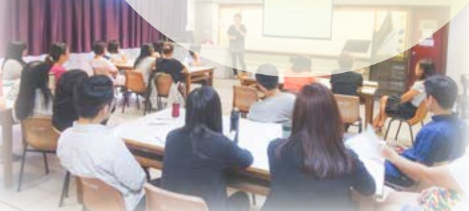
藉教師專業發展，為學校團隊增值。

因此，學校推行教師共同備課、觀課及課後反思，讓教師從互相觀摩和分享中，交流教學實踐的經驗和心得。