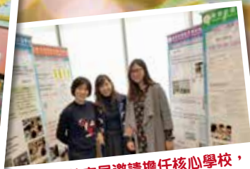
本校獲教育局邀請擔任核心學校，並參加校本資優教育交流展。