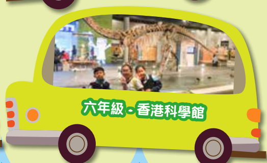
六年級 - 香港科學館