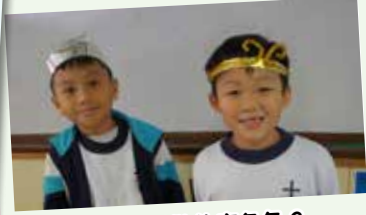
猜猜我們做什麼角色？