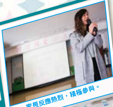
家長反應熱烈，積極參與。

為了讓家長更了解子女在學校的學習情況，學校於 11 月 30 日舉行「親親課堂」活動，邀請一至三年級的家長走進課室與子女一起上課。本年度的活動非常成功，家長的反應也十分熱烈。當天有約 120 位家長參與「親親課堂」活動。家長的回應正面，表示支持是次活動，及感謝老師的付出，欣賞老師以多元化的教學，增加課堂的互動，讓同學更投入學習。此外，家長大都認同是次活動有助其了解子女在校的學習情況，也十分認同老師運用不同提問、合作學習及學習策略去鼓勵學生多參與、多探究、多思考。就讓我們一起來回顧當天的活動花絮和家長的心聲。