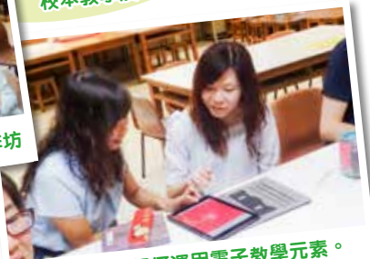
老師在鑽研如何運用電子教學元素。