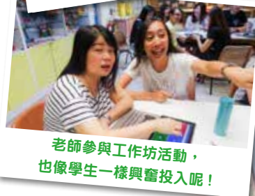
老師參與工作坊活動，也像學生一樣興奮投入呢！