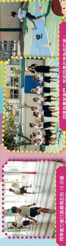
同學接力進行跳繩馬拉松 15 分鐘，盡展堅毅的精神。

為了協助班主任建立良好的班風，學校利用多元課時培養學生良好的品格素養，從個人堅毅的精神、勤奮的態度，至群體的合作、互相尊重的態度等。