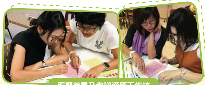
照顧差異及教學適應工作坊