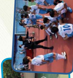
參加校外大型運動比賽，擴闊眼界