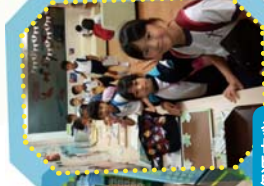
三年級 - 屯門康樂體育中心