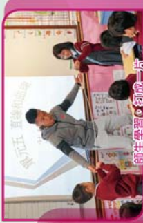
師生學習，初成一片