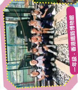
一年級 - 香港鐵路博物館

本校安排名級學生到不同地點參觀，透過這次全方位學習，著學生多觀察，多思考，利用所搜集的資料進行探究，提高學生學習興趣。