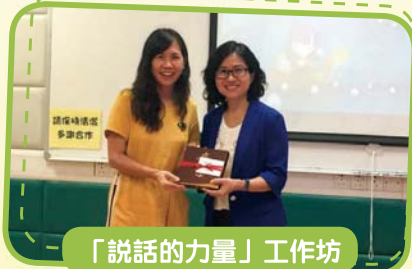
「說話的力量」工作坊