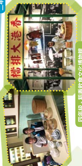
四年級 - 稻香飲食文化博物館