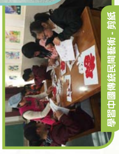
學習中國傳統民間藝術 - 剪紙