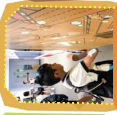
五年級 - 機電工程署 能源效益事務處教育徑