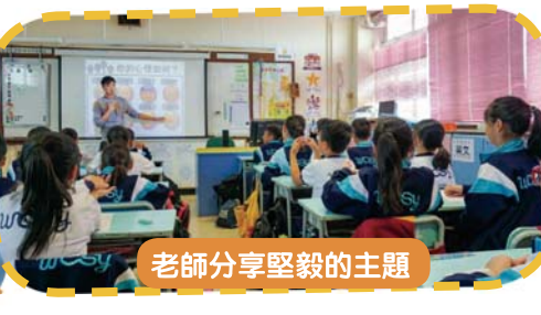
老師分享堅毅的主題