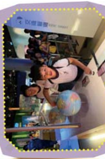
六年級 - 香港科學館