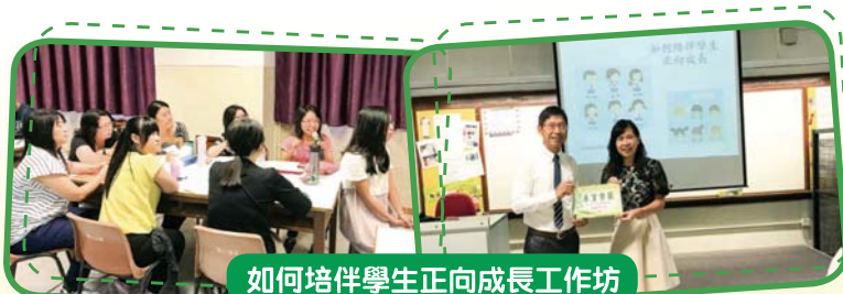
如何培伴學生正向成長工作坊

加強教師的專業能力，優化教學，學校舉辦了不同的教師工作坊及校內外教師專業交流活動。教師專業發展活動的主題十分多元化，包括學與教範疇、正向教育及如何與學生溝通等，以裝備教師，提升教學質素，建立學習型團隊。