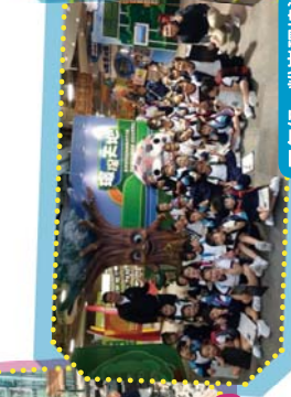
二年級 - 粉嶺環境資源中心