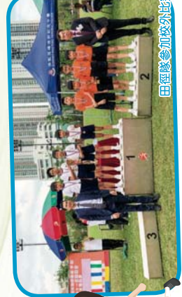
田徑隊參加校外比賽取得佳績