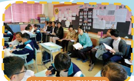
其他學校老師到校觀課

學校繼續與教育局小學課程發展組合作，更把專業協作的文化推廣至生教科。本年度，學校參與由教育局舉辦的「價值觀教育學習圈計劃」，教育局人員到校與本校四、五年級的生教科老師進行共備、交流及觀課，提升價值觀教育的成效，培養學生正面的價值觀和積極的人生態度。