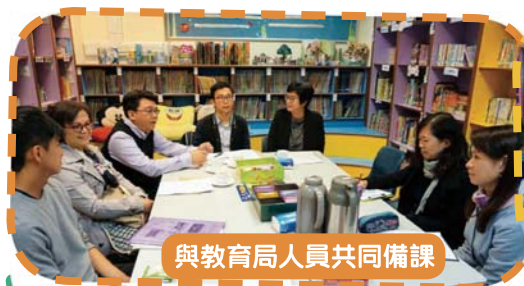
與教育局人員共同備課