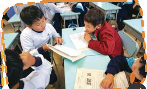
同學分享堅毅的心得