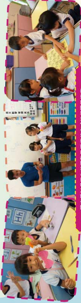
班主任以多元化的活動及活潑的方式進行班風培育

另外，教師亦會定期召開班風管理 1+4 會議，成員包括中、英、數、常科任，目的主要是讓各科任了解各科上課的課堂氣氛、注意事項，共同建立良好班風。