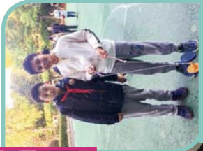
學習國粹藝術 - 抖空竹