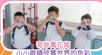
奇妙萬花筒 小小眼睛欣賞世界的色彩