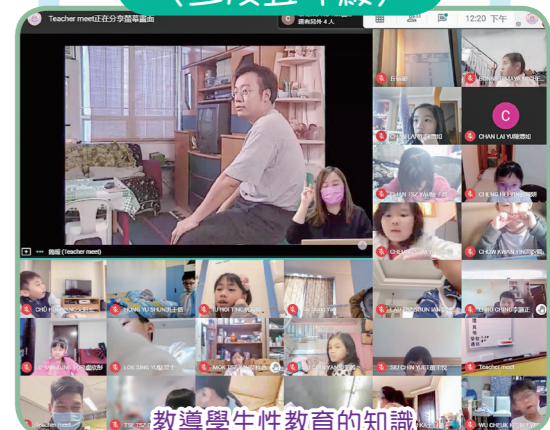
教導學生性教育的知識