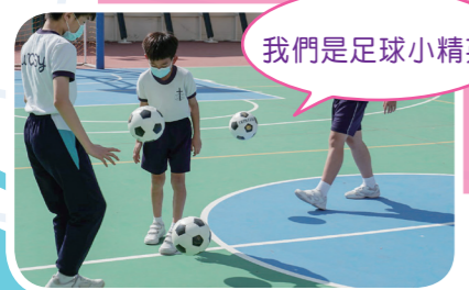
我們是足球小精英