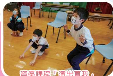
資優課程「演出真我」 培養學生解難能力及團體合作精神