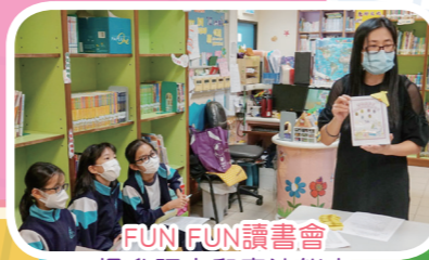
FUN! FUN! 讀書會 提升語文和表達能力