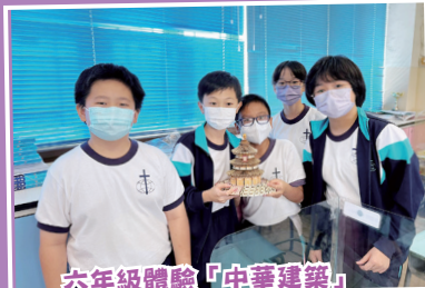
六年級體驗「中華建築」 榫卯結構活動