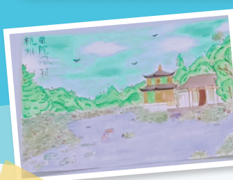
「中國名勝古蹟」明信片設計作品