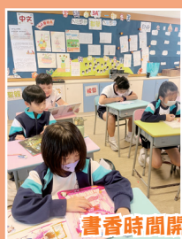
書香時間開始了！大家都在專心地閱讀着……