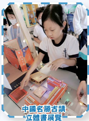
中國名勝古蹟 立體書展覽