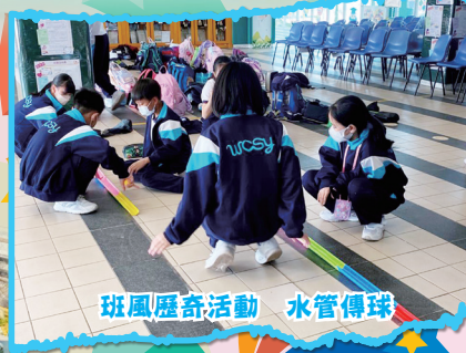
班風歷奇活動 水管傳球