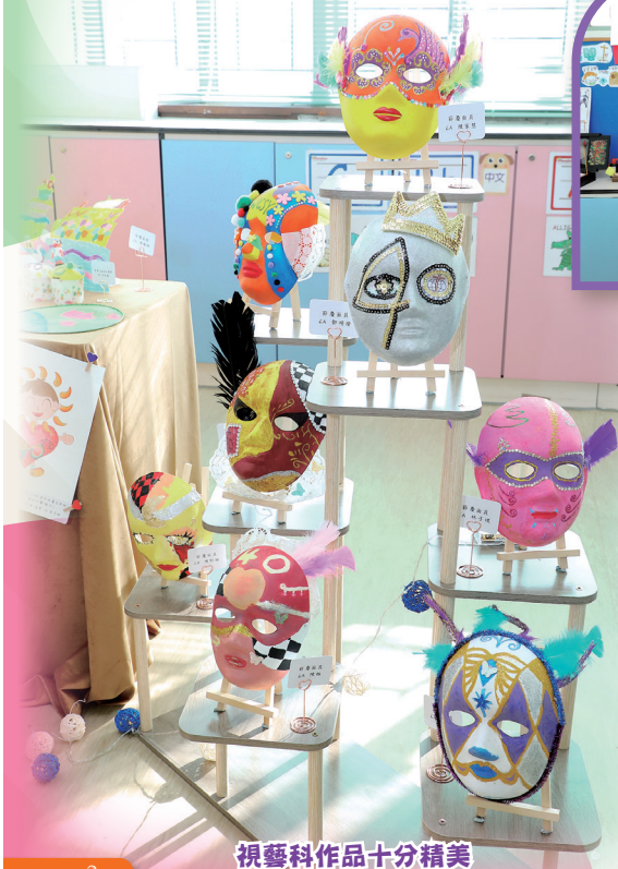
視藝科作品十分精美