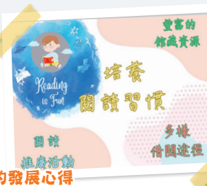
分享學校的發展心得