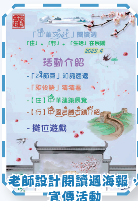
老師設計閱讀週海報， 宣傳活動