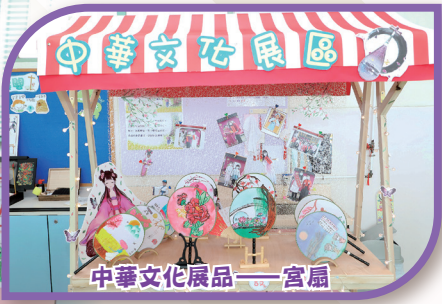
中華文化展品——宮扇