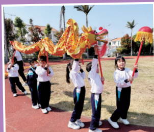
三年級體驗「舞龍」活動