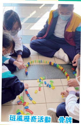
班風歷奇活動 骨牌