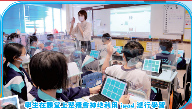
學生在課堂上聚精會神地利用ipad進行學習

本學年，本校推行電子教學，各科均嘗試在課前、課中、課後運用電子學習工具，例如：Wordwall、Kahoot、Nearpod……發展互動教學模式，期望透過互動的學習方式提高學生的學習動機和興趣，促進學生主動參與學習，啟發學生自主學習。此外，老師亦透過電子平台展示學生的作品，促進生生之間的互動，並給予即時的回饋。