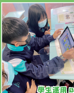
學生運用BLOCK與組員討論人類活動如何影響生物鏈