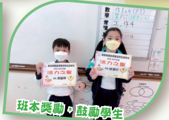
班本獎勵，鼓勵學生