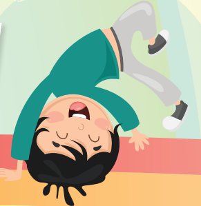
同學收到讚賞便條，得到很大的鼓勵