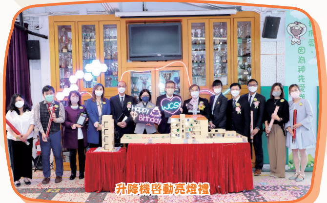
升降機啓動亮燈禮