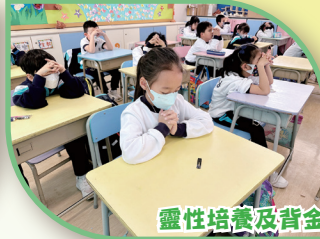
靈性培養及背金句活動