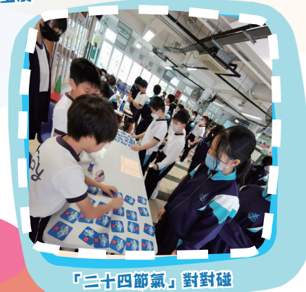
「二十四節氣」對對碰