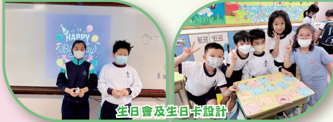
生日會及生日卡設計