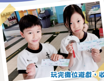
玩完攤位遊戲，收穫心愛的書籤

為提升學生的閱讀興趣，培養他們建立良好的閱讀習慣，本年度學校於四月底舉行了閱讀週，以「中華文化」之民間生活，希望透過介紹與中國古代間生活息息相關的「二十四節氣」、人們口口相傳的「歇後語」、中國建築特色，以及中國名勝古蹟，增加學生對古代中國民間生活的認識，培養學生的民族自豪感。