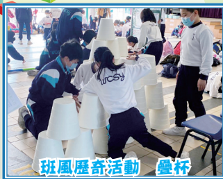
班風歷奇活動 疊杯