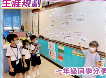
一年級同學分享「夢想的職業」