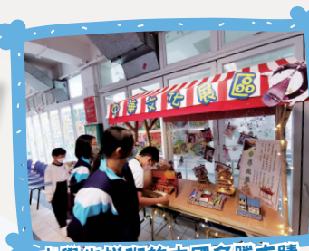
由學生拼砌的中國名勝古蹟 建築模型展