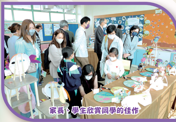
家長、學生欣賞同學的佳作