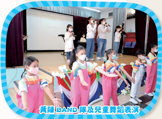
黃陳BAND隊及兒童舞蹈表演