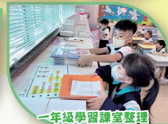
一年級學習課室整理