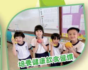
培養健康飲食習慣