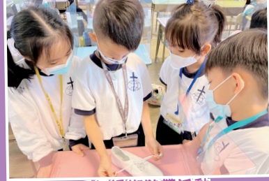
三年級綁鞋帶活動